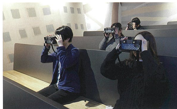
▲東館3階 ハザードVRポート