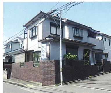
▲尽心庵(じんしんあん)外観

また、みささぎ会では尽心庵(じんしんあん)無料低額宿泊所を開設し、社会復帰を目指す人に寄り添うような支援を行っています。大阪生団連において災害支援の仕組みをどのように行うか、現在支援を行っている方々の意見を伺うことでより具体的な支援の構築を進めて参ります。