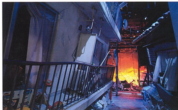
▲西館4階 震災直後のまち